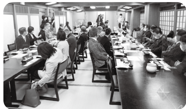
忘年会、新木本支部長の挨拶