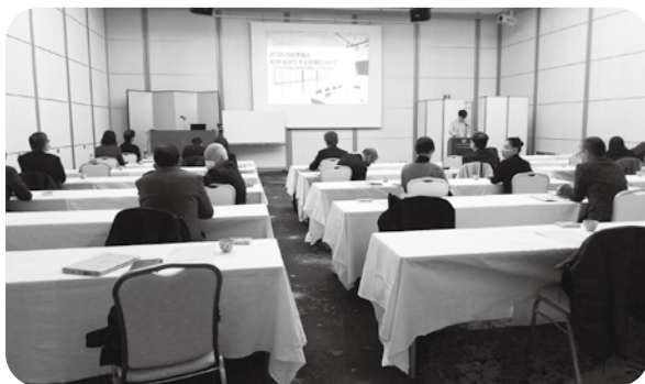
研修の始まる前の様子