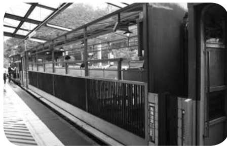
トロッコ列車リッチ号

「トロッコ亀岡駅」で降りて、保津川下りの乗船場はどこかと、堤防まで歩いてみたが、どこにも見当たらない。それもそのはず、乗船場は、駅から車で10分もかかる所にある。