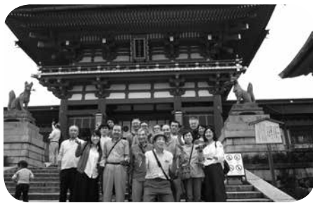
伏見稲荷大社にて

ここは伏見区深草藪之内町。全国に3万社ある「お稲荷さん」総本宮。稲荷信仰の原点の標高233メートルの稲荷山に稲荷大神が鎮座されたのは、奈良時代の和銅4年（711年）の2月初午の日で、2011年に鎮座1300年を迎え、今年で1307年となる。商売繁盛、五穀豊穡、家内安全、諸願成就の神として信仰されてきた。