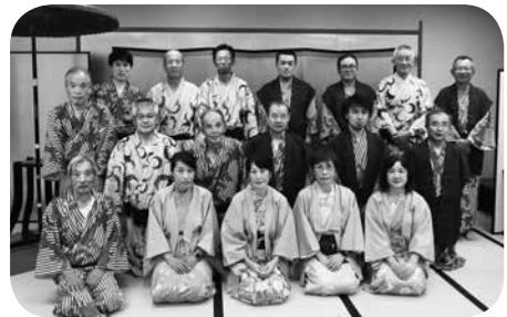
嵐山温泉渡月亭の夕食時

火を付けてくれる鍋をはじめ、朝食も豪華だ。「これは森嘉（もりか）の湯豆腐どすー。」ときた。