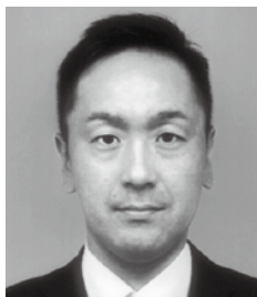
【氏 名】 わた 部 卓 【支 部】 中 予 【年 齢】 39歳 【開業／勤務／その他】 勤務その他