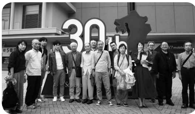
福岡ヤフオク!ドーム

先発二保投手が序盤に失点し、相手有原投手に5回までノーヒットの苦しい展開。売り子に注文するビールは2杯目をすでに飲み干している。ラッキーセブンの前の風船飛ばしをみんなでやった。黄色いジェッ