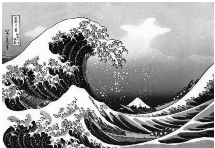
葛飾北斎「富嶽三十六景」

私は美術館が好きで以前は年数回は東京で美術館巡りをしてきたのだが中でも特に目がないのが浮世絵である。浮世絵の魅力は一言で語れるものではないし、私ごときが語ってよいものなのか定かではないが、一人でも多くの方にその魅力を知ってほしいとの思いからあえて筆を執らせていただく。