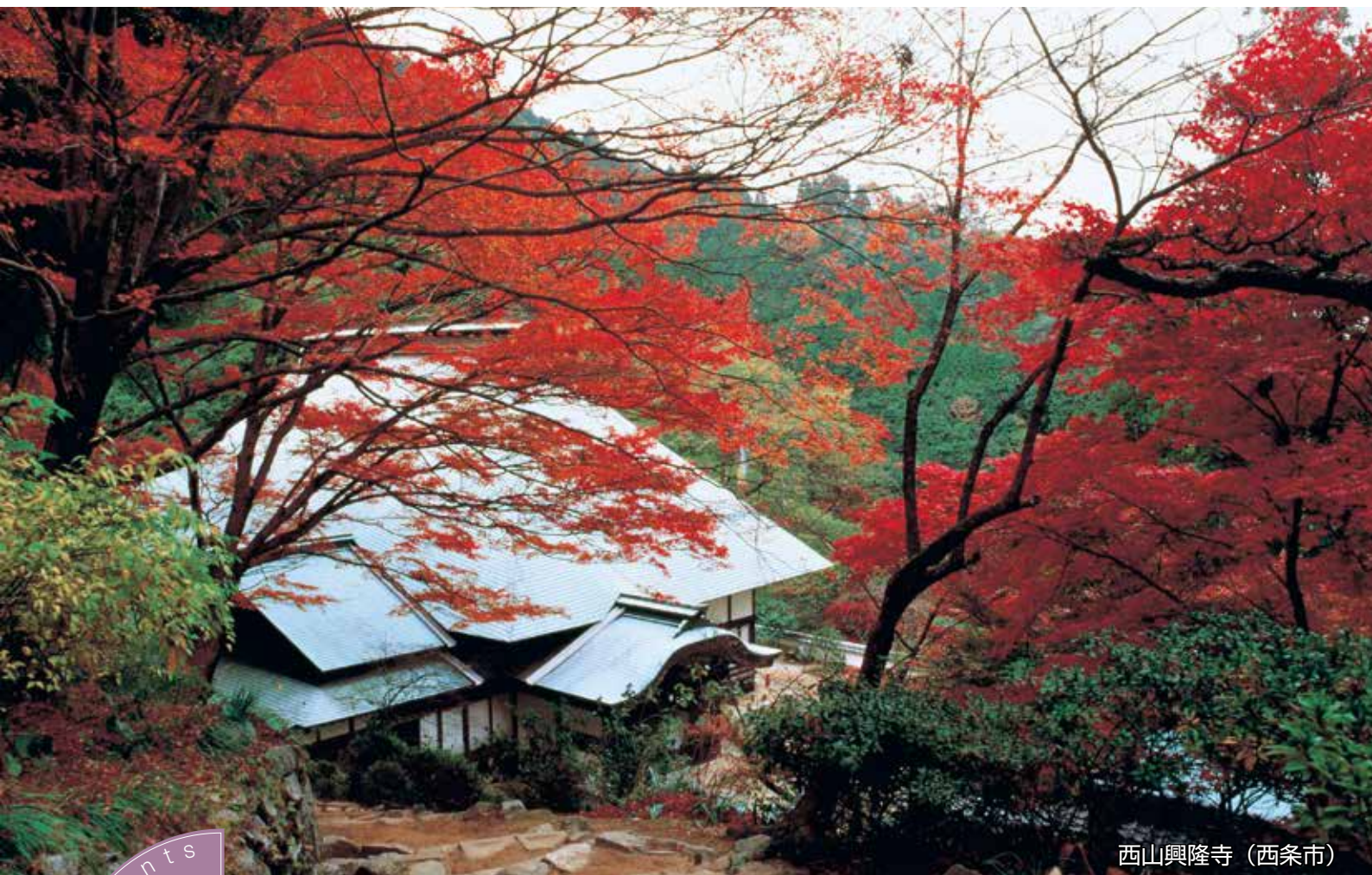
西山興隆寺（西条市）