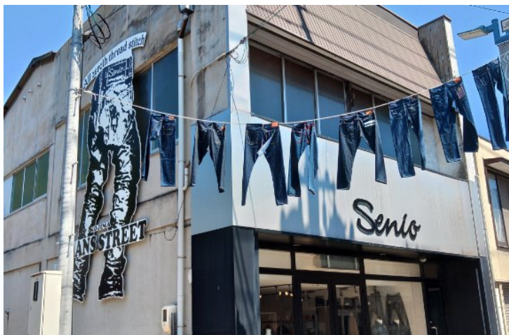
児島ジーンズストリート ジーンズの聖地 約40店舗のジーンズメーカーが店出

※各イベント等についてはお店の事情等により受付、開催されていない場合があります。